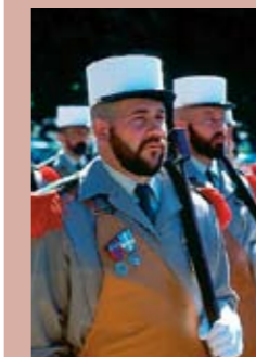
■ Defilé in Aubagne tijdens de viering van Camerone op 30 april.

Toen de Franse koning Louis-Phillipe op 10 maart 1831 het Vreemdelingenlegioen oprichtte, kon hij niet vermoeden dat dit korps zou uitgroeien tot een legende. Het was hem er eigenlijk om te doen om af te komen van de doorgewinterde soldaten die onder zijn voorganger Napoleon bijna heel Europa veroverd hadden. De koning vond het veiliger om deze vechttassen te stationeren in Noord-Afrika waar ze mochten bouwen aan een leger van ‘vreemdelingen’. Immers, een dergelijk leger zou makkelijker inzetbaar zijn als kanonnenvoer, dan een leger bestaande uit Franse dienstplichtigen. De Napoleonveteranen kweten zich zo goed van hun taak dat dit Vreemdelingenlegioen al snel bekend stond als het meest strijdlustige van de hele wereld. Het meest tot de verbeelding sprekende voorbeeld daarvan is de slag bij Camerone op 30 april 1863. Koning Napoleon III had het Legioen naar Mexico gezonden om het bewind van president Suarez omver te werpen. De 3e compagnie van het 1st bataljon van het Vreemdelingenlegioen werd geleid door kapitein D'Anjou, een oorlogsveteraan die zijn sporen had verdiend in de oorlog in Noord-Afrika. D'Anjou had zijn linkerarm domweg verloren bij een ontploffing van zijn eigen geweer en gebruikte sindsdien een houten kunstarm. In het kleine Mexicaanse dorpje Camerone kregen hij en zijn mannen het aan de stok met het leger van Suarez.